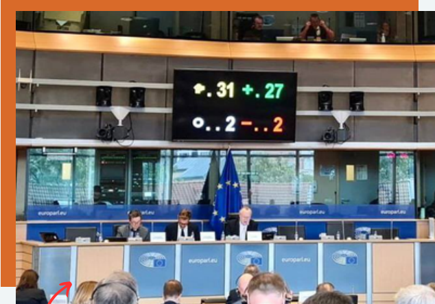
Adoption de l'accord en commission INTA

C'est une première mondiale . L'accord commercial entre l'Europe et la Nouvelle-Zélande est le premier à inclure le respect des Accords de Paris comme clause indispensable.