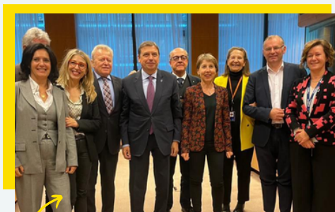
Accord trouvé en trilogue !

Ils ont trouvé un accord ! Accord bâti fin octobre sur les indications géographiques protégées en Europe. Les spécificités de nos gastronomies et des terroirs sont préservées : contrôle, étiquetage... mais aussi protection en ligne ! C'est essentiel pour nous, Européens et Français.