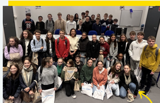
Avec les 3e de Paul-Émile Victor

Ravie d'avoir rencontré près de 100 élèves du collège Paul-Émile Victor à Château-Gontier. J'ai longuement échangé avec ces élèves de 3e sur la politique environnementale de l'Europe, sur mon parcours personnel... Et j'ai été heureuse d'y rencontrer des élèves qui s'appêtent à partir en Erasmus !