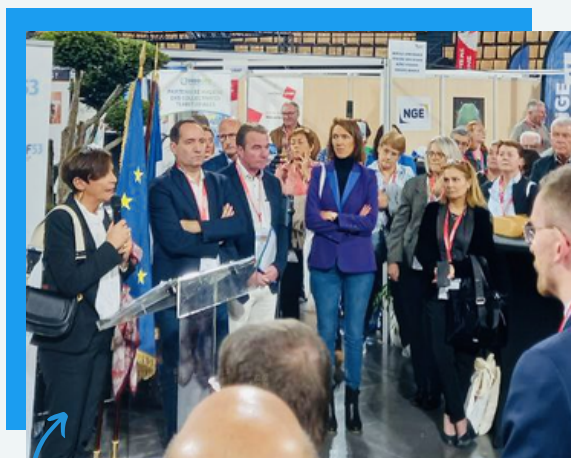
Avec les maires de Mayenne

Un incontournable de la démocratie locale en Mayenne : le Forum des élus locaux ! Organisé par l'AMF 53 et son président Joël Balandraud, il a été l'occasion de prendre le pouls du département à travers ses élus.