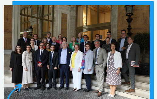
Une équipe de choc réunie en Italie !

Face à la montée des mouvements populistes aux tendances illibérales, Renew Europe continuera à montrer la voie du progressisme et de la fraternité . On continue !