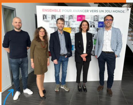
Avec l'équipe de MB Pack

La Mayenne recèle de talents pour notre transition écologique. J'en ai eu un nouvel exemple lorsque je me suis rendue à Vaiges, au siège de la société MB Pack .