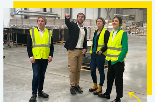
Des échanges nourris dans l'usine