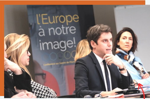
En réunion avec Gabriel Attal

La délégation L'Europe Ensemble continue ses échanges réguliers avec les membres du Gouvernement . Nous avons eu le plaisir d'accueillir le ministre Gabriel Attal à Bruxelles !