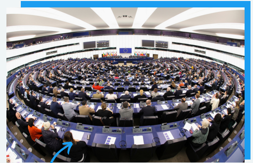
En hémicycle à Strasbourg !

Les bâtiments émettent plus d'un tiers des émissions de gaz à effet de serre en Europe. Notre objectif : un parc immobilier net zéro d'ici 2050 . Et pour réussir ce défi, on prévoit une batterie de mesures de soutien aux ménages , comme le Fonds social climat !