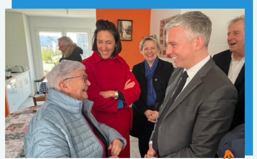
Avec Jean-Christophe Combe à Andouillé

Le vendredi 3 mars, j'ai accompagné le ministre des Solidarités et de l'Autonomie Jean-Christophe Combe lors de sa venue en Mayenne. À ses côtés, j'ai assisté à un Conseil national de la refondation sur le thème du bien vieillir à la maison de l'autonomie à Laval.