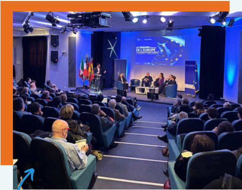
Dans le bel amphi de l'ESCP !

Dans le cadre de la Semaine de l'Europe , l'ESCP et EuropaNova ont conclu les débats sur la fierté européenne par une grande conférence sur les défis de l'Europe d'ici 2050 .