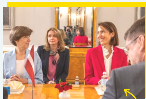
Au rythme du stratégique agenda ministériel !

Défense, transports, énergie... Autant de défis qui nécessitent une relation approfondie avec les pays baltes & nordiques. Et autant de défis à relever en Européens !