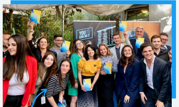
Lancement du Pacte à Bruxelles !