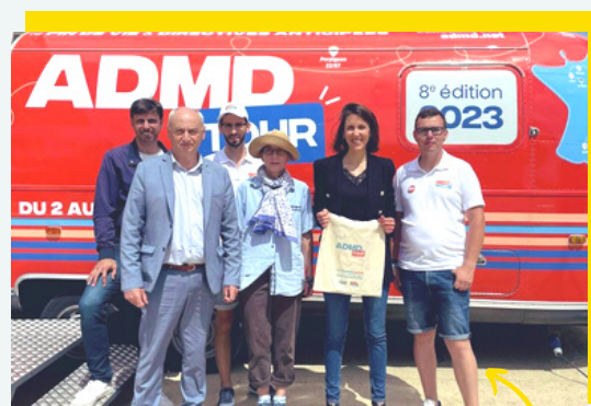
À la rencontre de la tournée itinérante ADMD Tour !

J'ai été heureuse d'aller saluer ces bénévoles engagés pour une belle cause : garantir une fin de vie digne . Des échanges passionnants avec une équipe engagée pour faire sauter les tabous et évoquer les directives anticipées ou encore la volonté des proches.