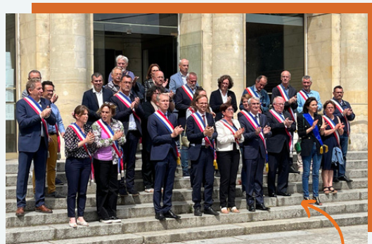
Rassemblés après les menaces aux élus

L'objet de ce rassemblement transpartisan : soutenir les élus ciblés par les violences subies dans le cadre de leur mandat. La République ne cède pas aux menaces.