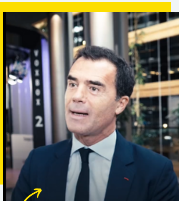
Explications de Sandro Gozi

Le Parlement, force de proposition ! Nous avons adopté des pistes pour une réforme des traités européens . Le but ? Bâtir une meilleure Europe, une Europe plus unie et plus écoutée.