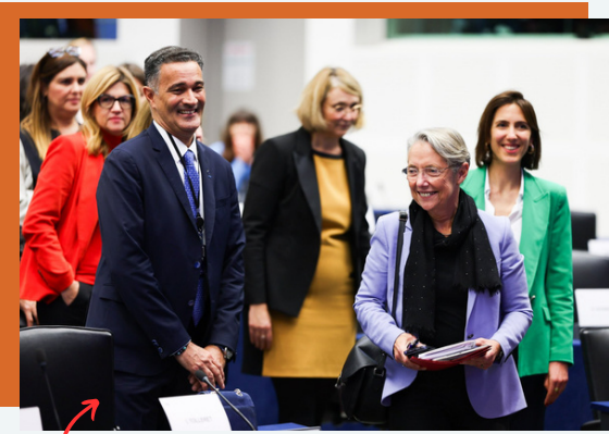
Arrivée d'Elisabeth Borne au Parlement

Nous venons d'inaugurer, aux côtés de la Première ministre , un tout nouveau bâtiment au Parlement européen de Strasbourg . Au nom évocateur : Simone Veil . Le saviez-vous ? Elle a été la première présidente du Parlement européen élu !