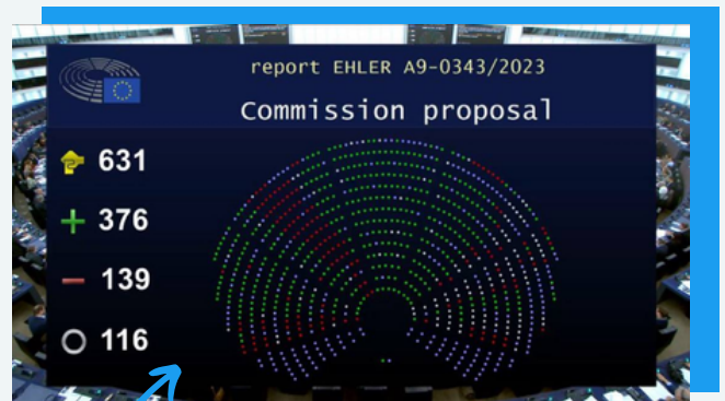
Adoption de notre position sur la loi pour les technologies propres

Ce texte, négocié par Christophe Grudler pour Renew Europe (et rejeté par les Verts et la majorité des Insoumis...), est un pas de plus vers la neutralité climatique que nous visons pour 2050 !