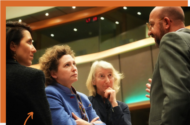
Échanges informels avec le président Charles Michel

Il est en effet urgent d'avancer sur notre souveraineté européenne . À l'occasion de ce séminaire, nos discussions ont donc aussi porté sur la puissance géopolitique de l'Union et les enjeux des entreprises européennes.