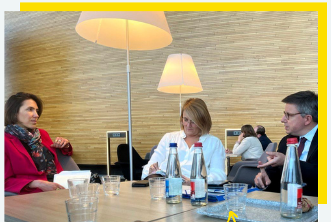
On fait le point sur nos dossiers européens