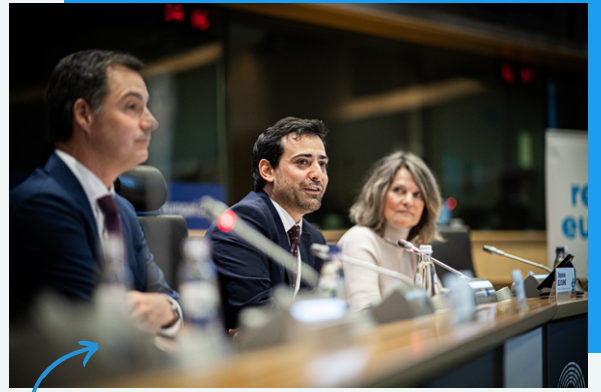
Aux manettes de l'évènement, Stéphane Séjourné !

Aux côtés de nombreux collègues, nous avons échangé avec des figures de notre famille politique : le Président du Conseil européen, Charles Michel, le Premier ministre belge Alexander De Croo ou encore le ministre des Affaires étrangères irlandais, Micheál Martin.