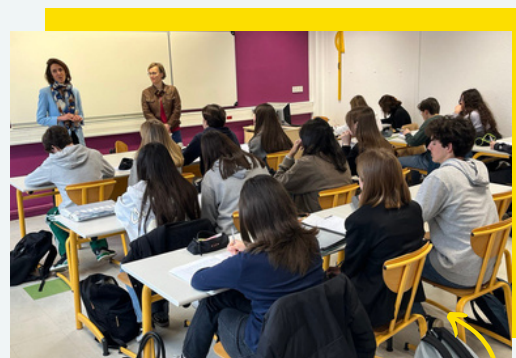
L'une de mes missions préférées d'élue européenne : débattre avec les jeunes !

À Strasbourg et à Bruxelles, la logique de compromis et de consensus prédomine dans tous nos travaux. Y compris avec nos oppositions républicaines les plus vives. Une source d'inspiration , peut-être un jour, pour l'opposition à l'Assemblée ?