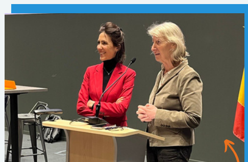
Avec Catherine Chabaud à Angers !

Durant une semaine, 130 lycéens ont travaillé sur des résolutions sur le thème de l'Europe en transition . Cette cérémonie était l'occasion de les découvrir et d'échanger avec ces lycéens ! Merci à eux pour leur accueil, ainsi que pour nos débats sur l'Europe !