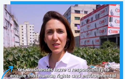
Sur le lieu du Rana Plaza, j'explique en vidéo le but de cette directive (cliquez sur l'image !)