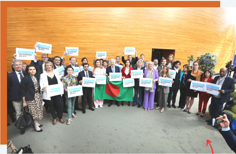
Nous nous sommes mobilisés le 24 avril

Le 24 avril 2013, le Rana Plaza s'effondrait. 10 ans plus tard, j'ai initié un rassemblement commémoratif du groupe Renew Europe aux côtés du Commissaire à la Justice Didier Reynders et de notre président Stéphane Séjourné .