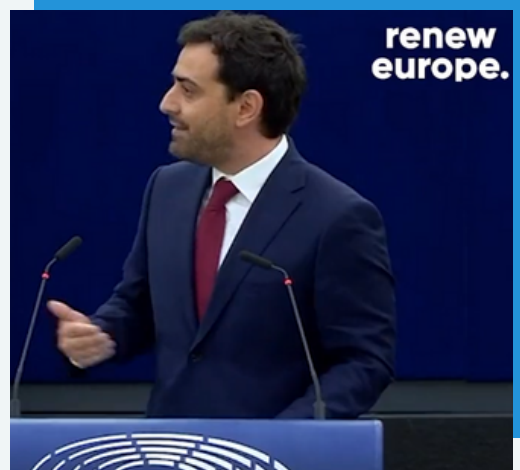
Intervention de Stéphane Séjourné à Strasbourg

Mais il est aussi revenu sur l'urgence (!) de se saisir des questions d' ingérence de régimes étrangers, notamment une ingérence financière, dans certains partis européens !